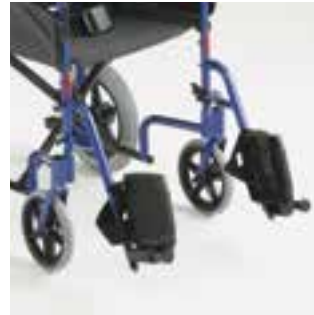
Palettes relevables et potences escamotables Permettent un accès facilité au fauteuil roulant lors des transferts.