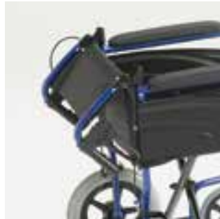
Dossier pliant à mi hauteur Permet de réduire la hauteur du fauteuil pour le transport et le rangement.

La maniabilité d'un fauteuil roulant est primordiale, c'est pourquoi l'Invacare Alu Lite a été conçu de manière à être très facile à pousser et à manœuvrer, aussi bien à l'intérieur qu'à l'extérieur. Grâce à son faible encombrement (largeur d'assise + 80 mm), il est facilement manœuvrable dans tous types d'espace, mêmes étroits.