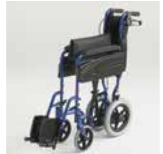
Châssis pliant par croisillon