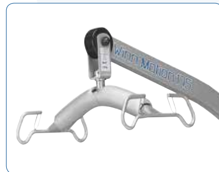
Fléau 4 points sécurisés.