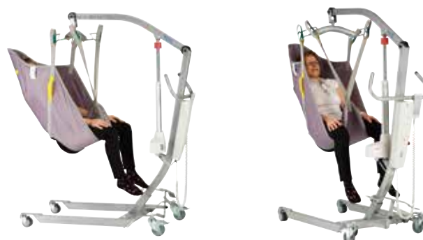
Sangles disponibles : Bain Fletty, 3D confort, avec ou sans têtes, 2 tailles (M ou L)