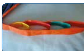
Différents réglages des sangles grâce à des repères de couleur.