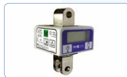
Option système de pesée Classe III Médicale (175 kg Précision 0,100 g)