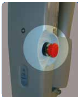
Bouton arrêt d'urgence