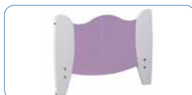
Panneaux adaptés à l'univers des enfants : Blanc/Kiwi ou Blanc/Parme