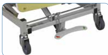
Option : freinage centralisé. Accessibilité et facilité d'activation