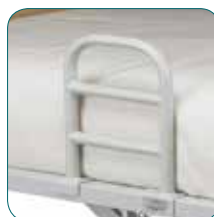
Poignée d'appui (disponible en accessoire).