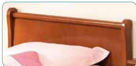
Louis-Philippe, classique et rassurant, disponible en 140 et 160 cm.